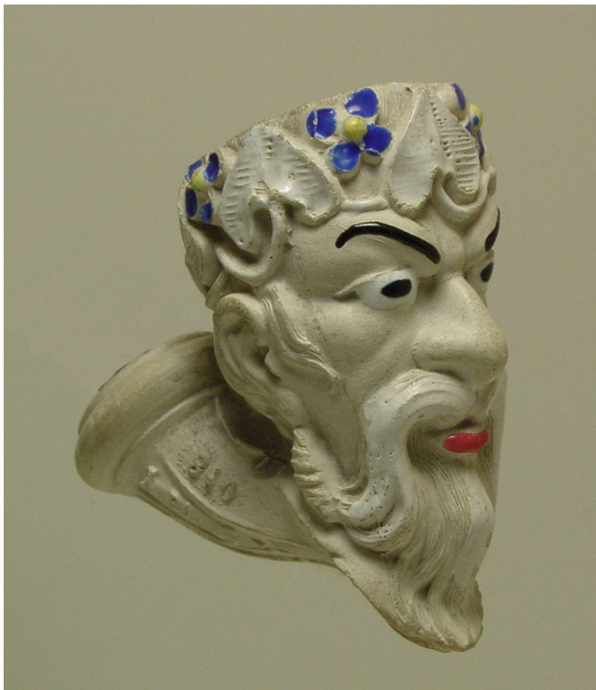
Afb. 3. Satyre, tête (vormnr. 810). Collectie auteur.

meer menselijke uitdrukking dan de overige satyrs; een bebaarde mannenkop met puntige in plaats van normale oren (afb. 3) en rondom zijn hoofd een rank met bloemen en puntige bladeren. Dit model werd afgebeeld in de catalogi uit 1879 en 1886.