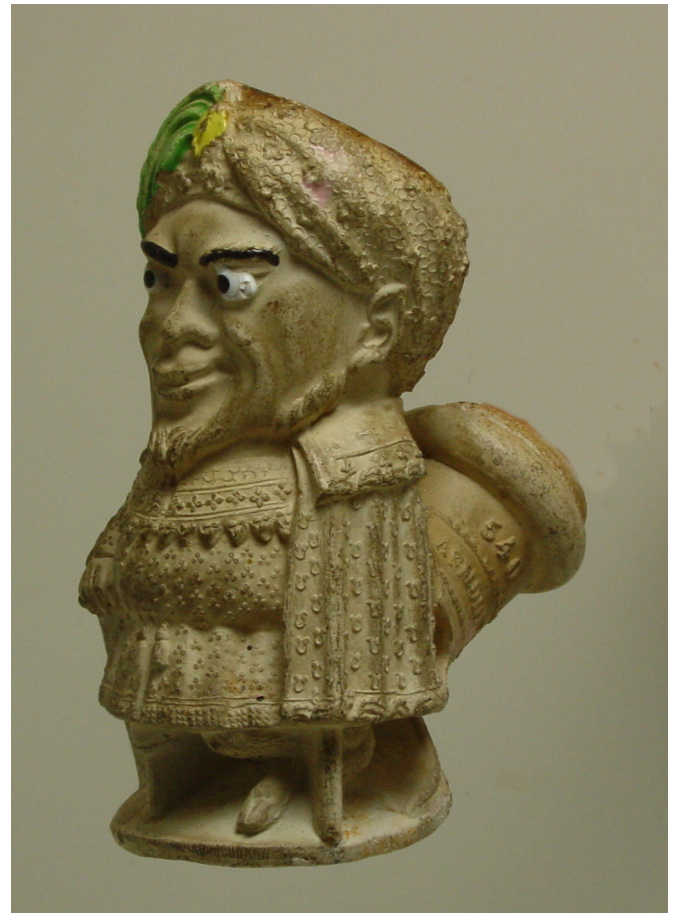
Afb. 13. Asmodée, Tête (vormnr. 540). Collectie auteur.

De pijp met de afbeelding van deze demon is 'Asmodée' (vormnummer 540), een zeer zeldzame pijp met figurale ketel zonder hiel en met een oplopende steel en manchet. De ketel is in de vorm van een staande man met grijnzend gezicht op een plateau. Hij heeft een tulband op het hoofd met een aantal naar rechts hangende veren. Om de schouders heeft hij een mantel van geborduurde stof geslagen en in zijn rechterhand houdt hij een wandelstok. Het rechterbeen is van hout en het linkerbeen stelt een hoef voor. De steelaanzet heeft grote halfronde inkepingen. Op de steel staat in reliëf 'ASMODÉE' (afb. 13).