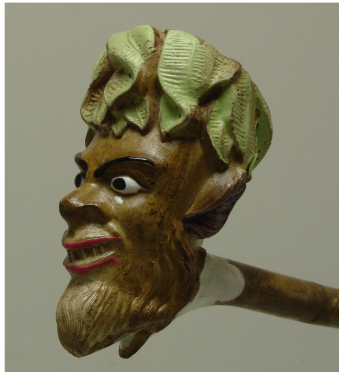
Afb. 15. Faune, fantaisie (vormnr. 753).