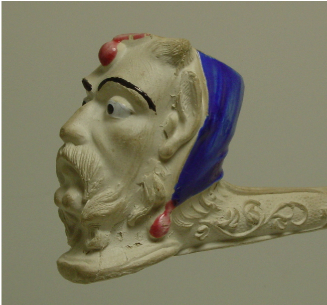
Afb. 11. Diable, fantaisie (vormnr. 1189). Collectie auteur.