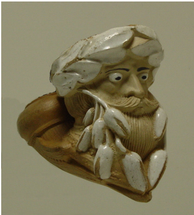
Afb. 14. Faune of Roi des Aulnes? (zonder vormnr.). Collectie auteur.

Een andere bosgod die verwant is aan faun is Sylvain . Deze beschermer van bomen, planten en kudden, werd ook afgebeeld met puntige oren, een baard en bladeren rond het hoofd. Gambier had een pijp in het assortiment met dit personage als beeltenis. In 1879 zien we in de catalogus voor het eerst 'Le Sylvain' onder vormnummer 798 (afb. 19). In twee latere catalogi is hij ook nog afgebeeld 5 .