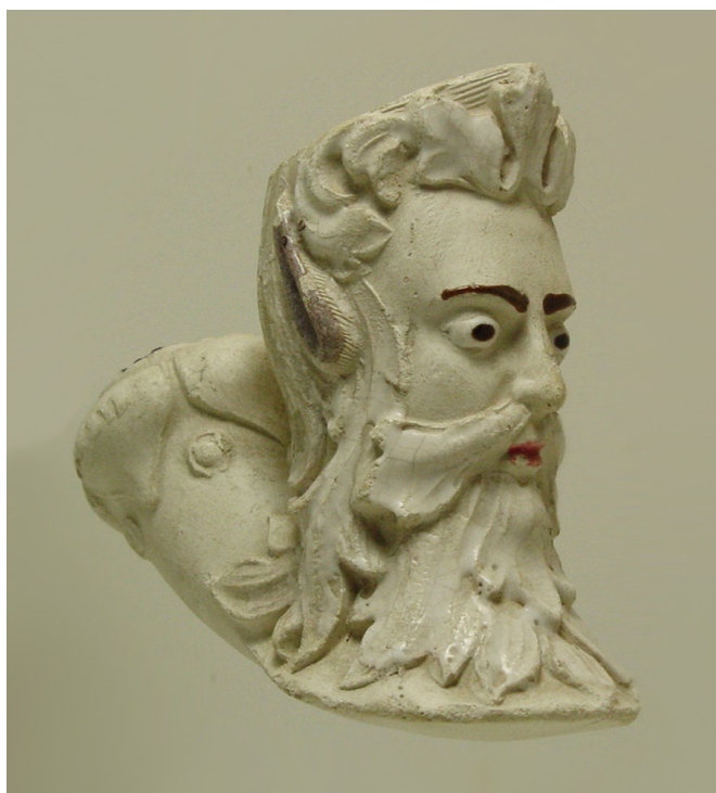
Afb. 18. Midas, tête (vormnr. 700). Collectie auteur.