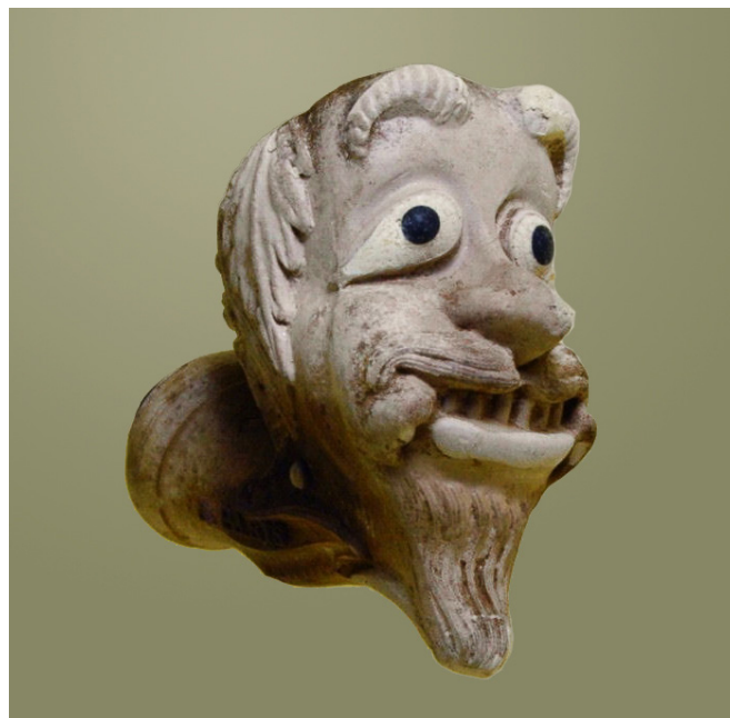
Afb. 7. Onbekend (vormnr. 722). Collectie auteur.

Een unieke pijp die gevonden is op het terrein van de voormalige Gambierfabriek wilde ik niet onbesproken laten. Het betreft een zeer fraai ontwerp van een duivelskop met opengesperde mond en diepliggende oogkassen waar mogelijk glazen ogen in geplaatst konden worden (afb. 8). Hij heeft een kromme neus en een puntsik en langs de zijden van de kop zijn vleugels