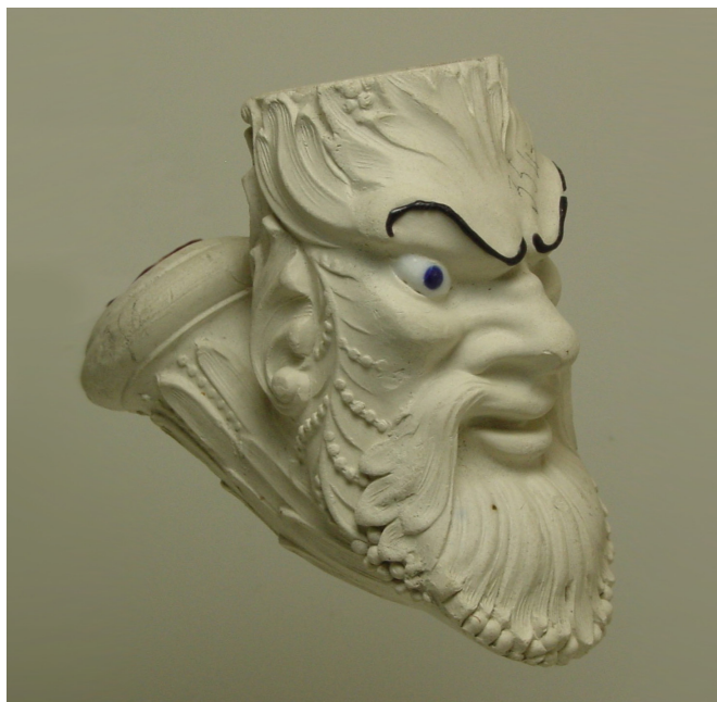
Afb. 6. Méphistophélès, tête (vormnr. 511). Collectie auteur.

Een zeer fraaie manchetskop van Lucifer (vormnummer 541) werd voor het eerst vermeld in de inventarisatielijst uit 1858 van de groothandel van Gambier in Parijs. Deze figurale pijp met gebogen steel en manchets kreeg de vorm van een grijnzende man met een gedraaid sikje, een opstaande mond waaruit twee omhoog gekrulde tanden steken en dikke wenkbrauwen waarboven twee gestileerde hoorns naar achteren krullen. De onderzijde van de ketel werd gedecoreerd met puntige bladeren, op de omhoog gebogen steel werd een gerasterd patroon aangebracht. De steel is aan de onderzijde gemerkt met JG.