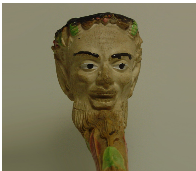
Afb. 16 en 17. Faune, fantaisie (vormnr. 1209). Collectie auteur.

Het roken uit pijpen met een angstaanjagend ontwerp als de duivel of een daar op gelijkend figuur moet populair geweest zijn gezien de vele ontwerpen met dit thema. Ze behoorden lange tijd tot het assortiment, in ieder geval van rond 1830 tot de jaren 20 van de twintigste eeuw. De namen werden in de catalogi en de bekende 'nomenclatures' van Gambier door elkaar gebruikt waarbij de onschuldige sater soms als duivel benoemd werd. Naast duivels maakte Gambier ook nog vele ontwerpen in de vorm van een monster of andere mysterieuze fantasiefiguren. Blijkbaar sprak het roken uit dergelijke pijpen tot de verbeelding.