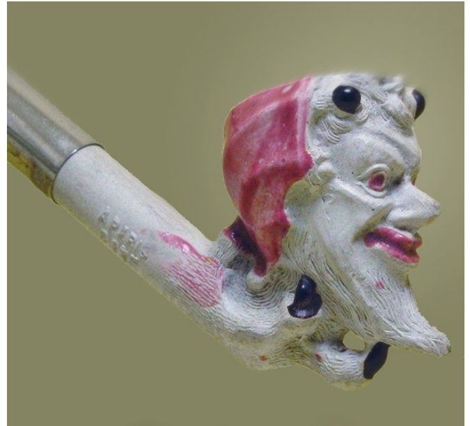
Afb. 12. Méphistophélès, Tête (vormnr. 2033). Collectie auteur.

om een pijp met een oplopende steel en een gebogen steeleind met knoop. De ketel is in de vorm van een smal duivelsgezicht met vooruitstekende sik. Om het hoofd zit een kap met de vorm van een vleermuizenvleugel. Vanaf de onderzijde wordt deze duivelskop vastgehouden door een behaarde klauw met vier tenen. Dit model wordt later als gemonteerde pijp met bus en caoutchouc roer onder vormnummer 2033 geïntroduceerd. Dit is het meest recente model met de afbeelding van een duivel. Op een affiche uit 1918 waarop een beperkt aantal Gambierpijpen wordt aangeboden zit deze gemonteerde versie in het assortiment.