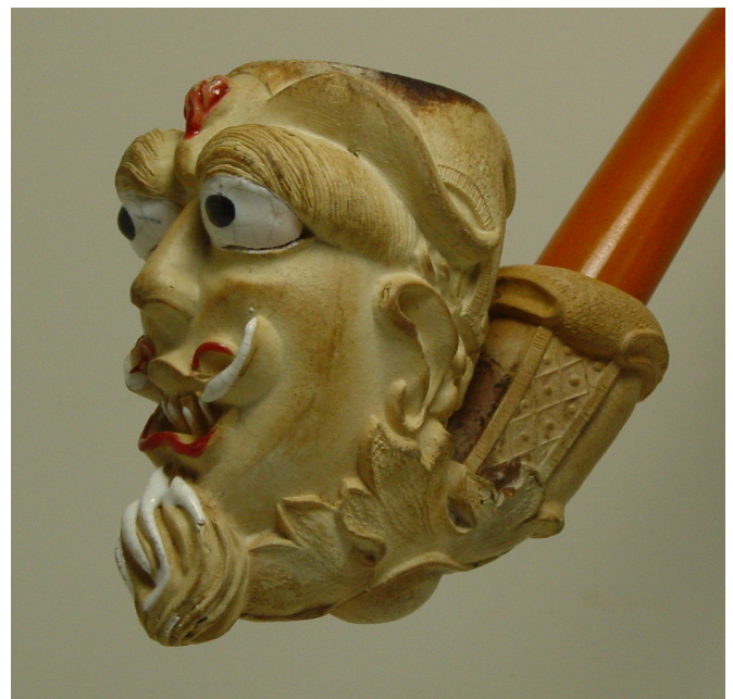
Afb. 5. Lucifer, tête (vormnr. 541). Collectie auteur.

Satan (Hebreeuws: שָׂטָן śāṭān, “tegenstander”) is een aanduiding in de Hebreeuwse Bijbel. Als de term op mensen betrekking heeft, betekent het tegenstander, valse raadgever of in enkele gevallen potentiële deserteur. Als gepersonifieerd hemels wezen komt de aanduiding Satan in de Hebreeuwse Bijbel op vier plaatsen voor.