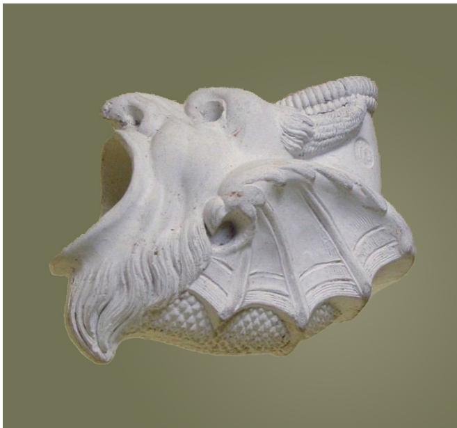
Afb. 8. Onbekend, gemerkt JG, (vormnr. onbekend). Collectie Declef, Givet.

te zien. De hoorns van de duivel steken naar achteren en lopen door tot de geribbelde manchets. Deze pijp is alleen gemerkt met JG in reliëf. De officiële benaming en het vormnummer van deze zeldzame pijp zijn onbekend.