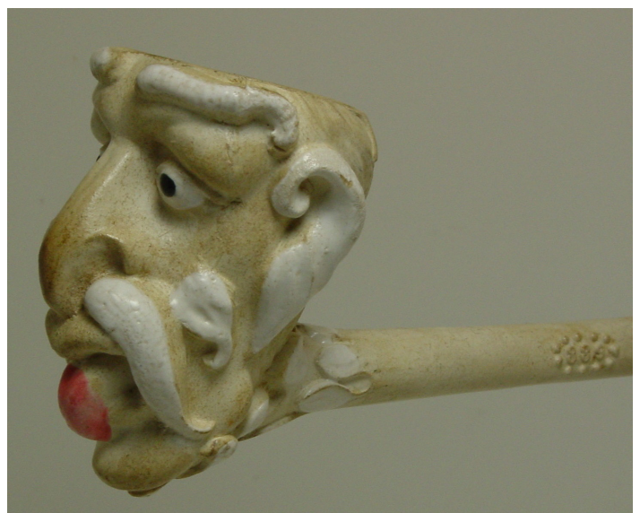
Afb. 10. Le Diable, fantaisie (vormnr. 889). Collectie auteur.

Een steelpijp met de afbeelding van een meer menselijke figuur met de benaming Diable vinden we onder vormnummer 1189 (afb. 11). Het is een pijp met een figurale ketel zonder hiel, een rechte steel en een afgeplat mondstuk met een knoop. De ketel is in de vorm van een mannenhoofd met snor en dikke bakkenbaarden. Het hoofdhaar is bij de haargrens in twee punten gemodelleerd, waardoor het lijkt of hij hoorns heeft. Over de rest van het haar draagt hij een kap van stof met aan de punten een bal. Op de steelaanzet bevinden zich takjes. Deze pijp komt vaak voor met het merk Noël. Hierbij werd in de originele persvorm van Gambier een 'N' aangebracht voor het vormnummer en op het gladde deel van de steel werd een intagliostempel gezet met 'Noël à Paris'. Het vermoeden bestaat dat de man op deze pijp Méphistophèles uit de opera Faust van Charles Gounod is. Deze opera in vijf akten speelde voor het eerst in het Théâtre Lyrique in Parijs op 19 maart 1859. De pijp werd rond 1860 geïntroduceerd, kort nadat deze bekende opera in Parijs opgevoerd werd. De rol van Méphistophèles werd gespeeld door de bariton Jean Baptiste Faure (1830-1914). Het werd één van de meest vertoonde opera's in dat theater en verschillende nieuwe producties van het stuk volgden tussen 1875 en 1975. Een steelpijp met de naam Méphistophélès vinden we onder vormnummer 1673 (afb. 12). Het gaat hierbij