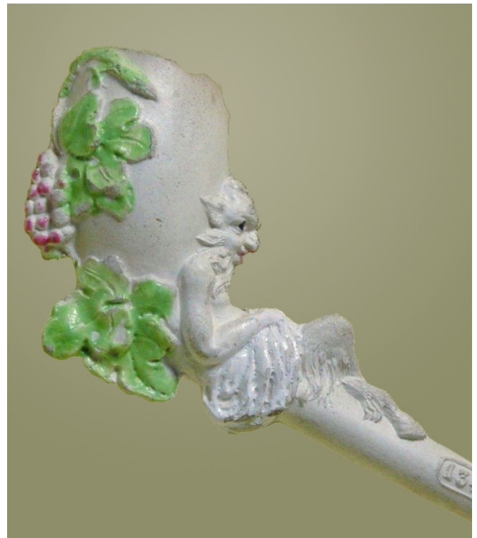
Afb. 4. Satyre, fantaisie (vormnr. 1345). Collectie P. Severin.

Lucifer is een Latijns woord dat letterlijk ‘lichtbrenger’ betekent. In het Latijn duidt het meestal op de Morgenster,