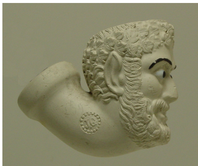
Afb. 1. Satyre (vormnr. 159). Particuliere collectie.

Rond 1850 kwam er opnieuw een manchetkop met een ontwerp in de vorm van een sater in het assortiment. Deze manchetpijp van Gambier kreeg de naam 'Satyre, Tête' met vormnummer 810. Deze kop zal rond 1850 in het assortiment zijn opgenomen want hij werd al vermeld in een inventarisatielijst uit 1858 van de groothandel van Gambier in Parijs. Deze pijp kreeg een