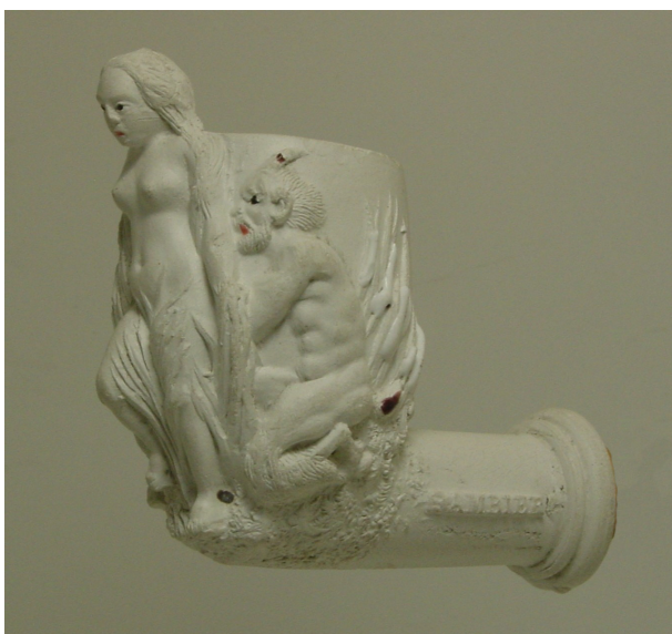
Afb. 9. Onbekend (vormnr. 686). Particuliere collectie.

Een andere pijp waarover weinig bekend is betreft een zeer zeldzame manchetspijp met vormnummer 686. Het gaat om een pijp met een staande, figurale ketel met rechte steel en een manchets. Aan weerszijden is een geknielde duivel met bokkenpoten en horens op de kop afgebeeld. Deze duivels houden een halfnaakte vrouw vast die in hoog reliëf op de voorzijde van de ketel staat. Aan de rechterzijde van de steel staat in reliëf 'Gambier' en aan de linkerzijde 'à Paris' en het vormnummer. Dit model is vermoedelijk korte tijd gemaakt en wordt in geen enkele catalogus of 'nomenclature' vermeld. Het