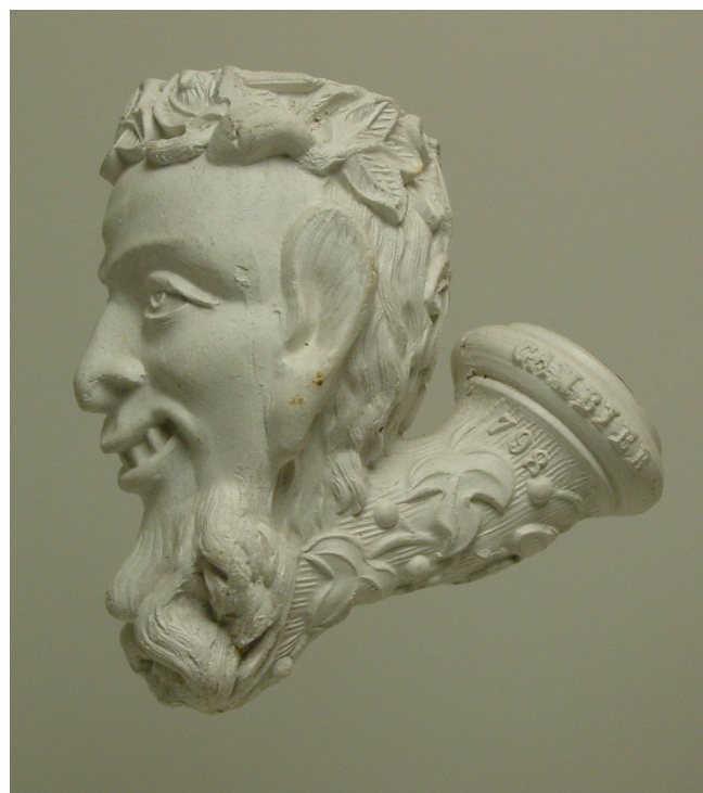
Afb. 19. Le Sylvain, tête (vormnr. 798).